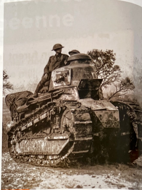
Doc. 4 Soldats américains dans un char d'assaut Renault FT 17 Lis, Argonne, Est de la France, 1918

Revêtus d'un masque à gaz, l'un utilise une mitrailleuse alors que l'autre s'apprête à lancer une grenade.