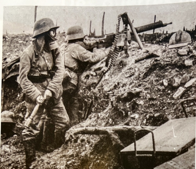
Doc. 3 Soldats allemands dans une tranchée, Verdun (Est de la France), 1916

Revêtus d'un masque à gaz, l'un utilise une mitrailleuse alors que l'autre s'apprête à lancer une grenade.